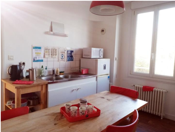
La salle de pause

Une salle de pause est à votre disposition au sein de l'agence avec micro-onde, plaque gaz, four et ustensiles de cuisine, ainsi qu'un réfrigérateur. Service de restauration à proximité. (Demandez la liste)