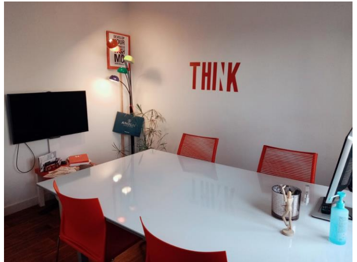
La salle de formation